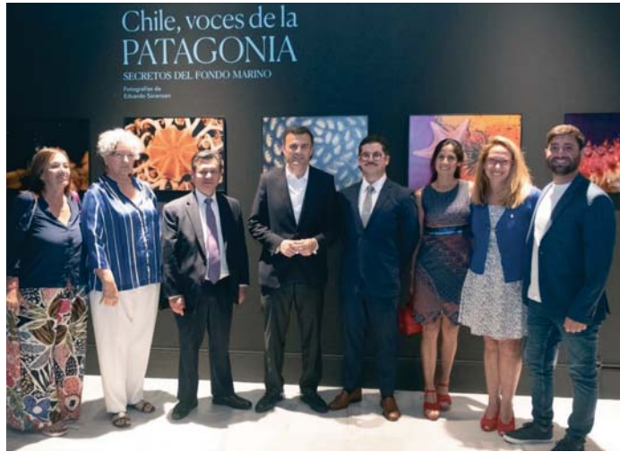
El alcalde de Cádiz, Bruno García, junto a Javier Velasco, embajador de Chile en España.