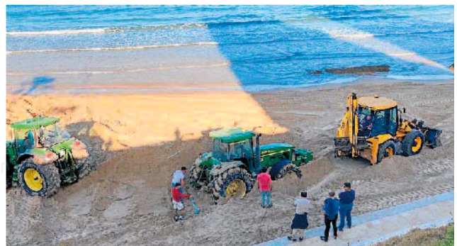
Los trabajos se realizaban ayer en la playa Santa María del Mar.

Fuentes de la Subdelegación del Gobierno apuntan al respecto que cada año se determina en qué playas se realizan estas labores, y además de en la Victoria y en Santa María del Mar también se van a