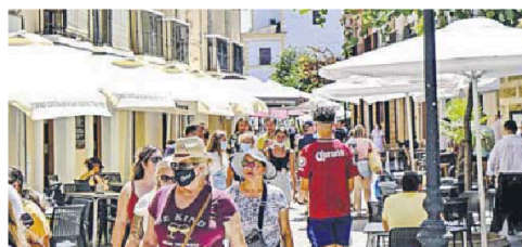
La zona de restauración en la calle Plocia.

nunciados administrativa y penalmente, según correspondía por el tipo de infracción cometida, siendo tres de las personas vecinas de Cádiz y otra de San Fernando.