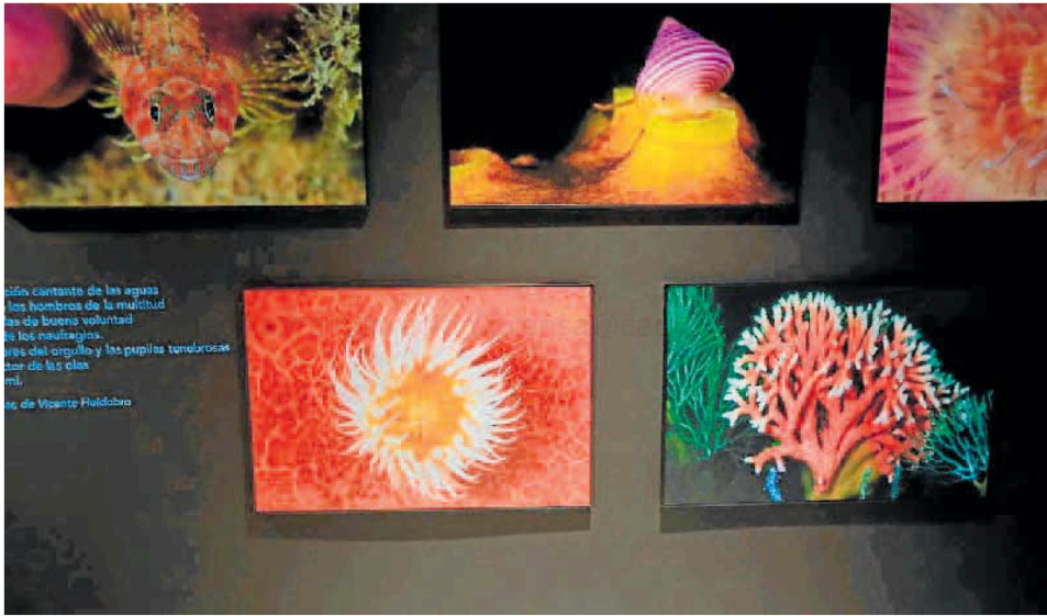
Fotografías de la exposición 'Chile, voces de la Patagonia. Secretos del fondo marino'.