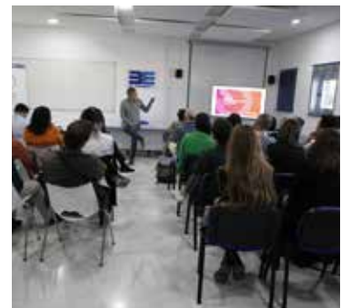
Visita a la Fundación Instituto Ricardo Valle de Innovación.