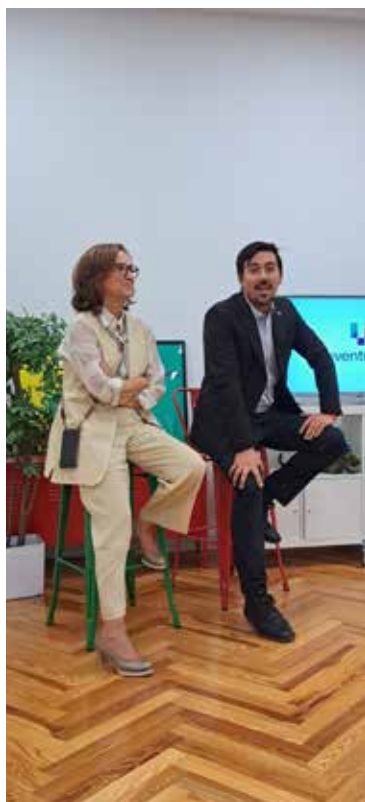
Encuentro en Madrid con emprendedores chilenos organizado por ProChile.