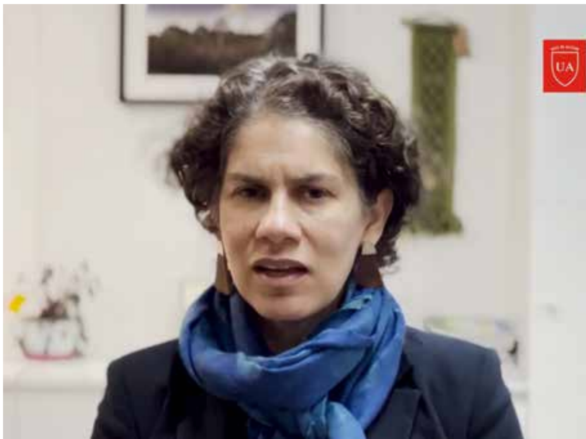
Maisa Rojas, ministra del Medio Ambiente de Chile inaugura el seminario sobre Economía Azul.