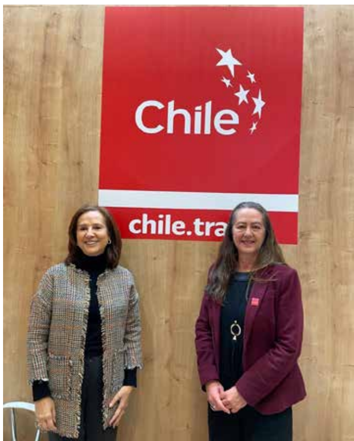
Volvemos a estar presentes en FITUR 2023.