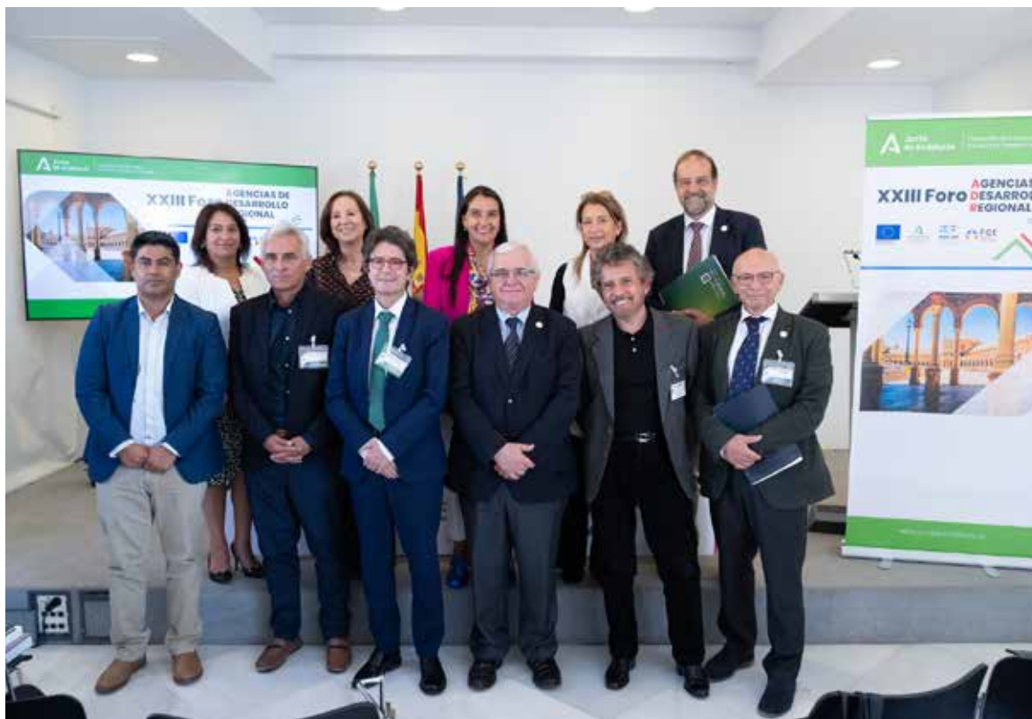
Delegación chilena organizada por FCE participa en el XXIII Foro ADR.