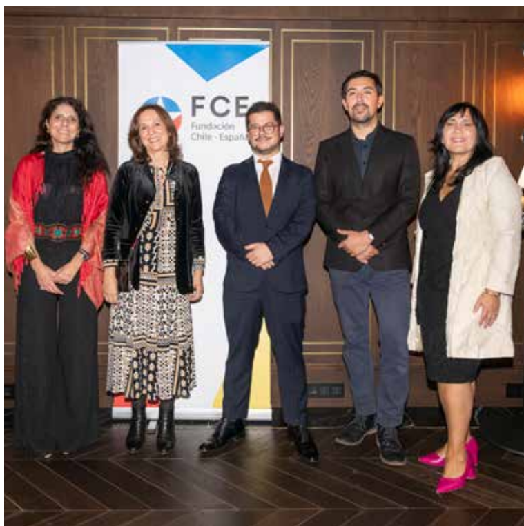
Bienvenida de FCE a Innovamos CAMACOES 2023.