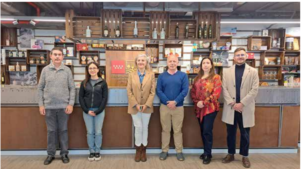
Asistentes a la visita al Centro de Innovación Gastronómica de Madrid.