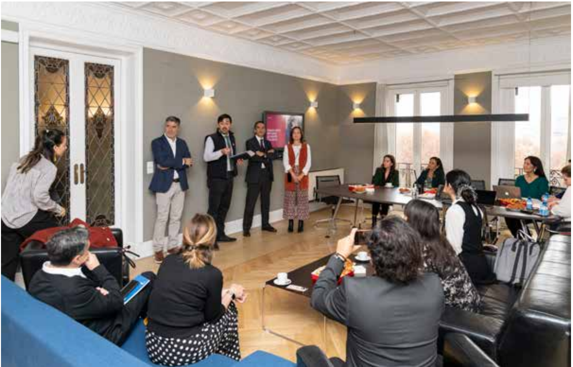
FCE organizó junto a ProChile un encuentro de diseño branding y packaging entre Chile y España.