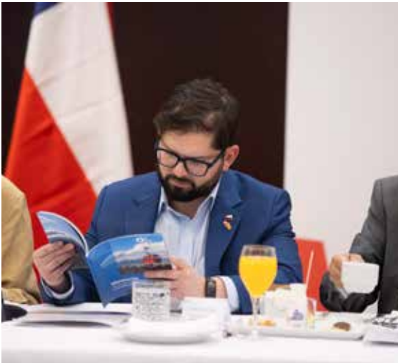
Gabriel Boric, presidente de Chile.