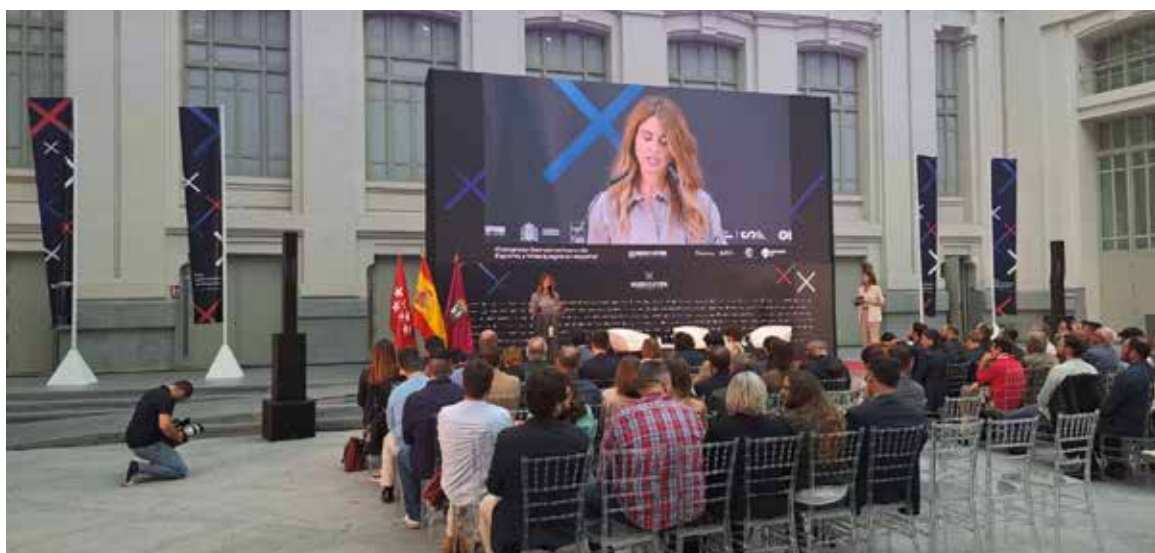
FCE presente en el Madrid Platform 2023.