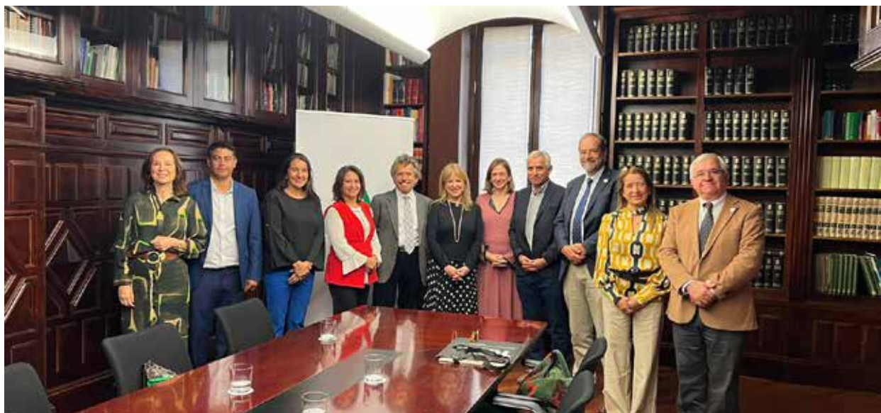
Delegación chilena se reúne con empresas e instituciones complementarias al XXIII FORO ADR.