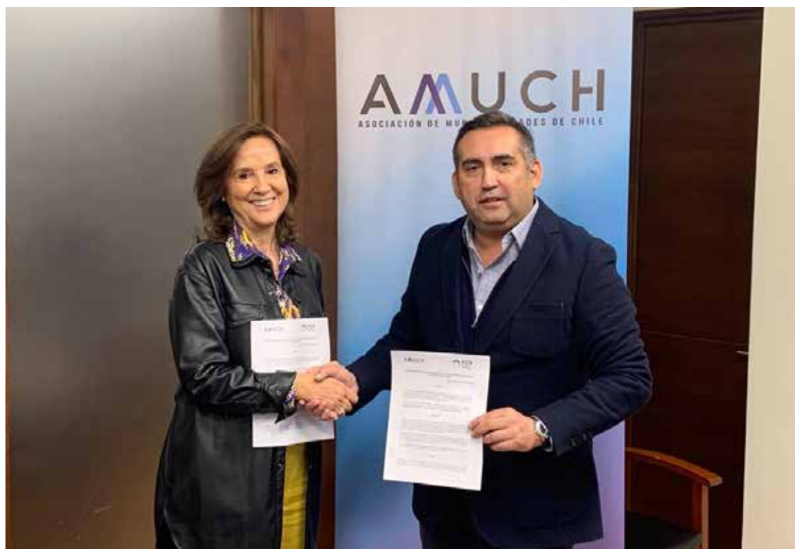
Fundación Chile-España firma un acuerdo con AMUCH.