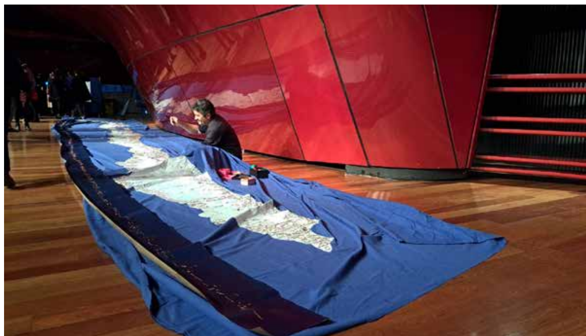
Actuación en directo de Álvaro Silva en el Museo Nacional Centro de Arte Reina Sofía.