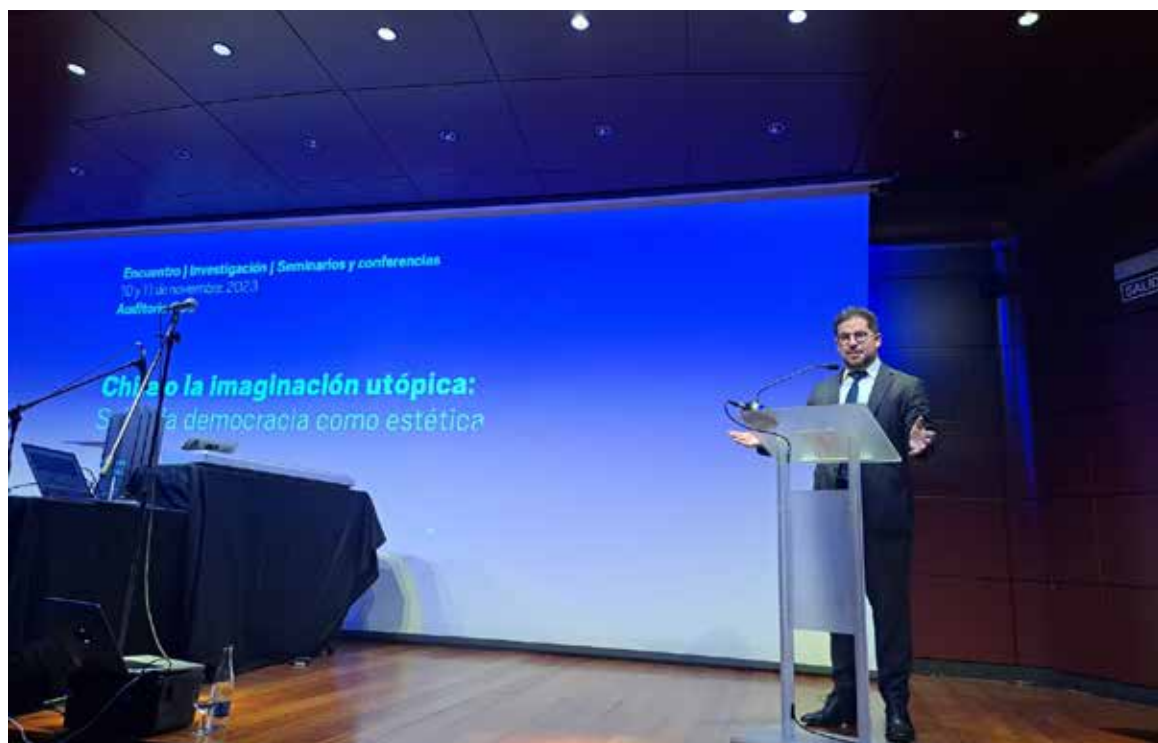
Encuentro poético a 50 años del Golpe de Estado en Chile, Museo Nacional Centro de Arte Reina Sofía.