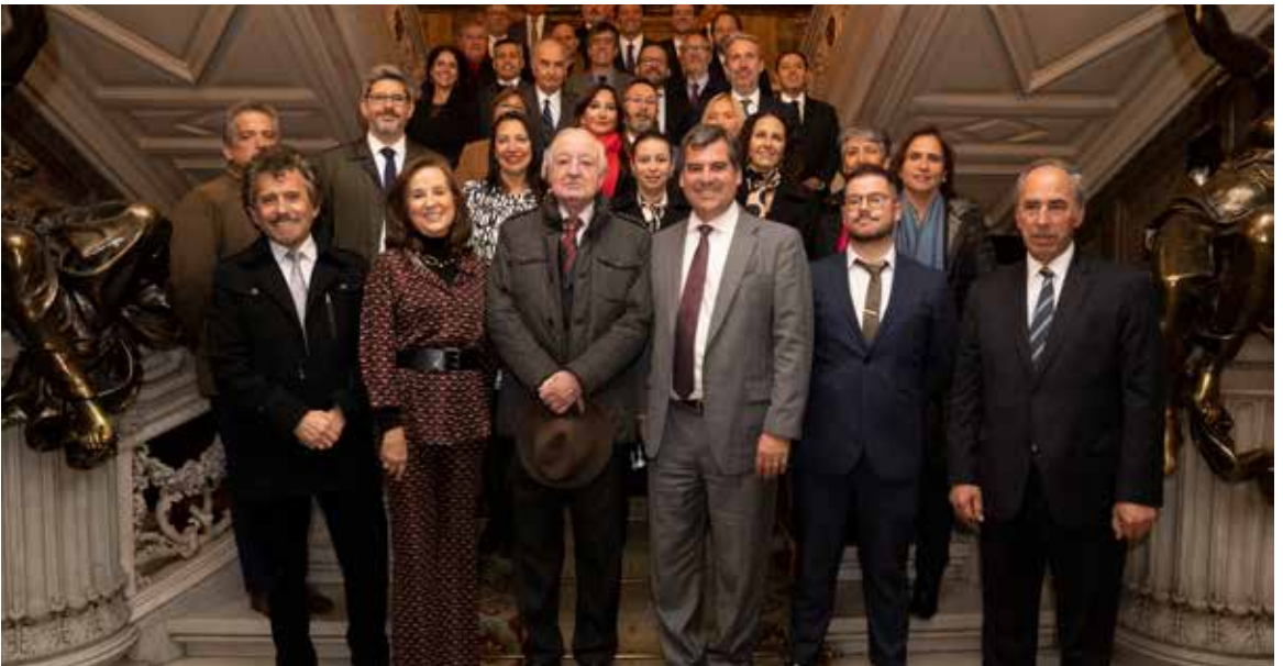
FCE y la delegación de Fundación País Digital en Casa América.