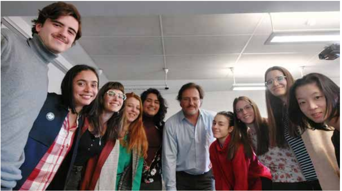
FCE patrocina la Cátedra Chile en la USAL: curso “Poesía chilena del siglo XX: testimonios de lo sagrado”.