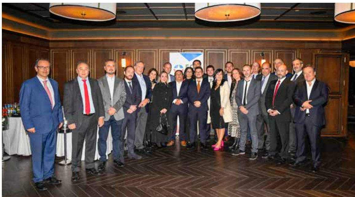
Networking en Innovamos CAMACOES 2023.