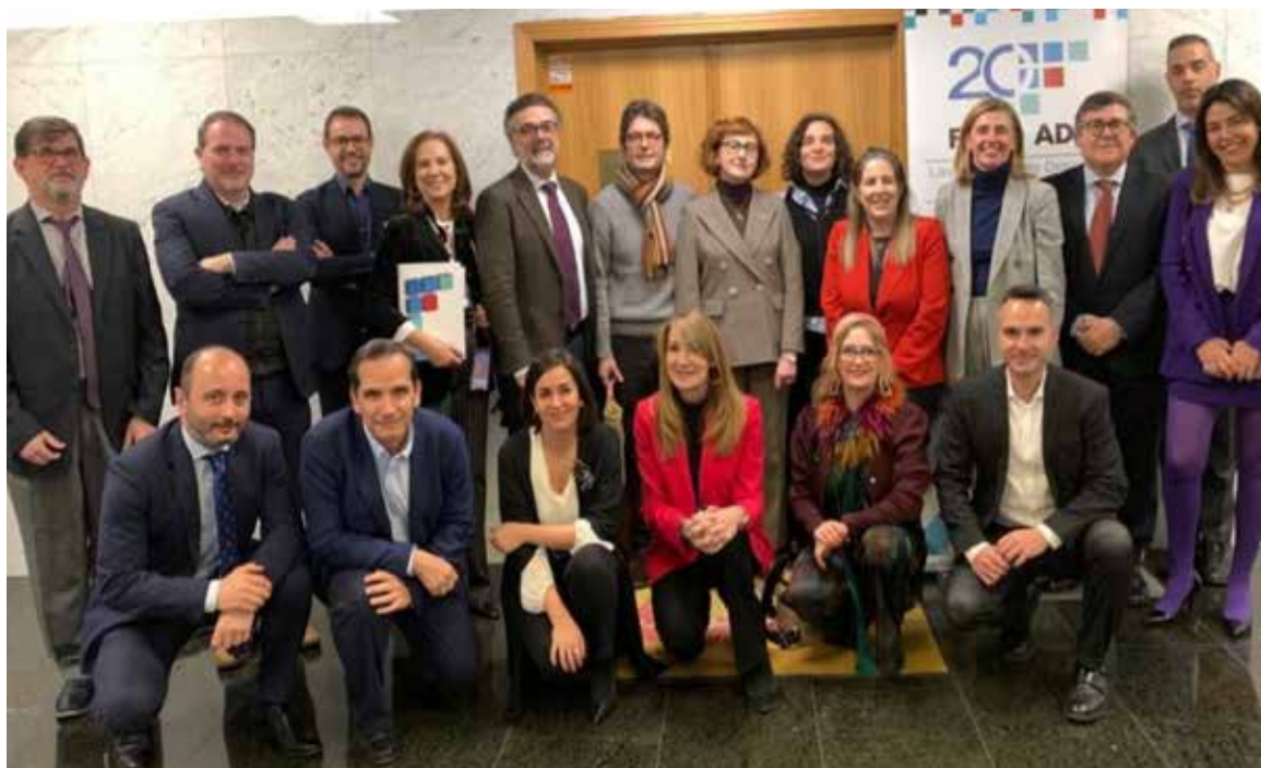
Reunión preparatoria para organizar delegación chilena en el XXIII Foro Anual de ADR.