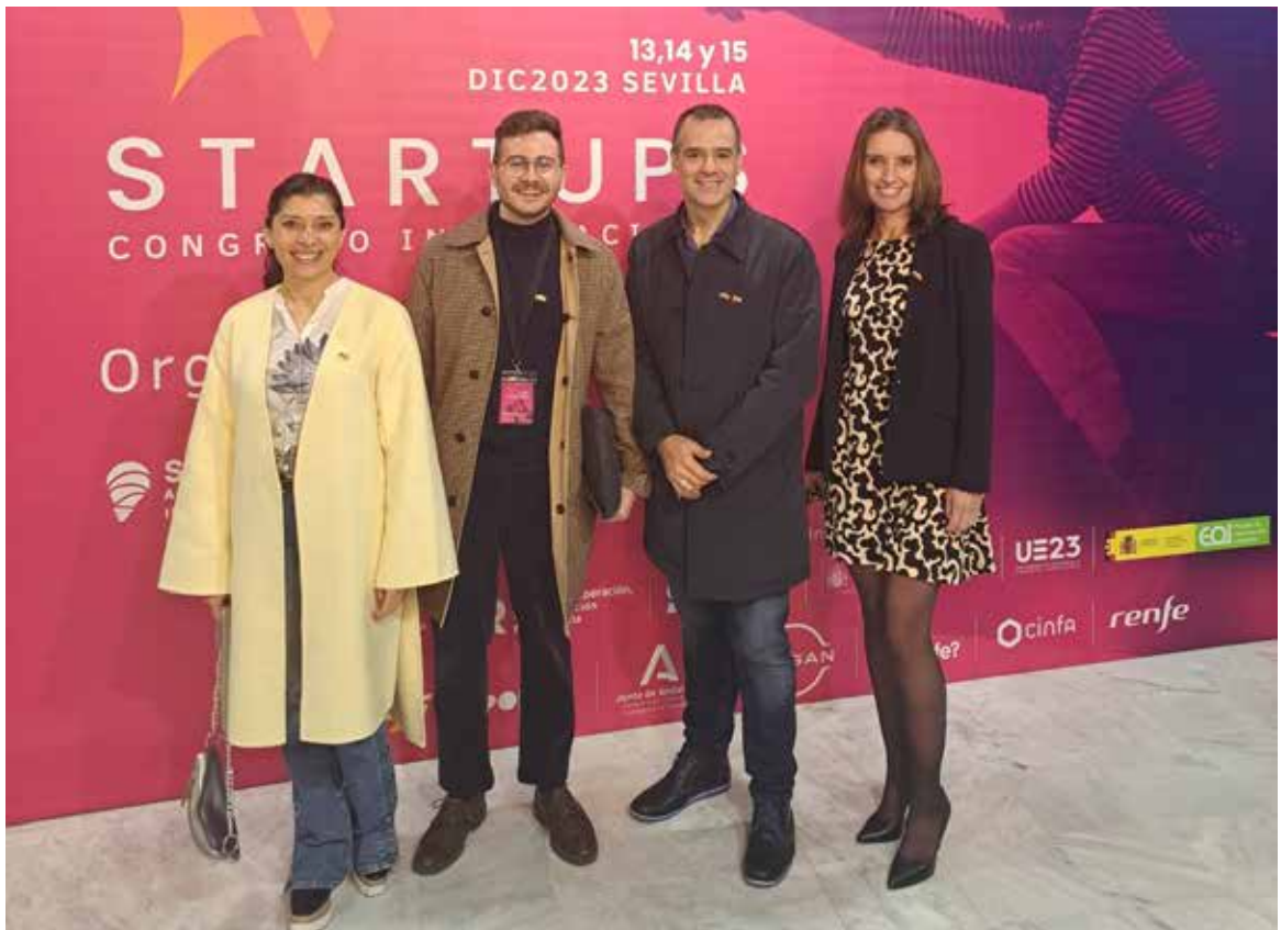
FCE acompaña a la delegación chilena presente en el Congreso Internacional de Startups.