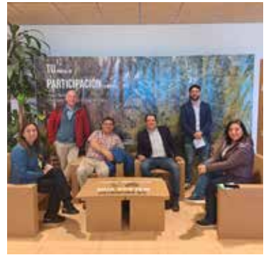
Interior de Sabor a Málaga.