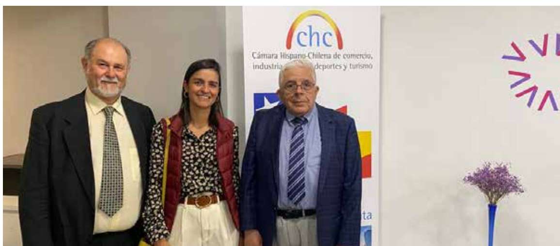
Acudiendo a la inauguración de la Cámara Hispano - Chilena de Comercio.