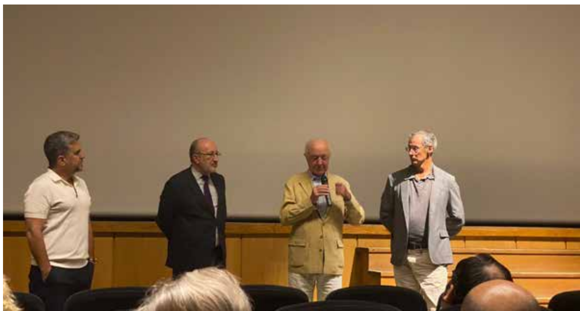
Homenaje a Jorge Edwards en el Teatro Casyc de Santander.