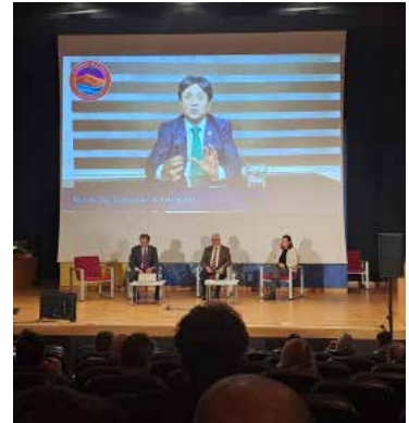
V Foro Aeroespacial Chile - España: “El Espacio: una nueva vía de colaboración público-privada”.