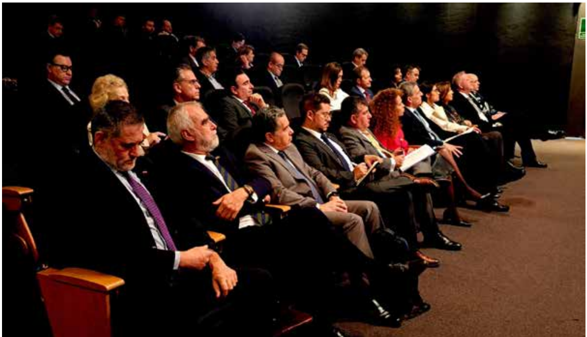
Asistentes del V Foro Aeroespacial Chile - España: “El espacio: una nueva vía de colaboración público - privada”.