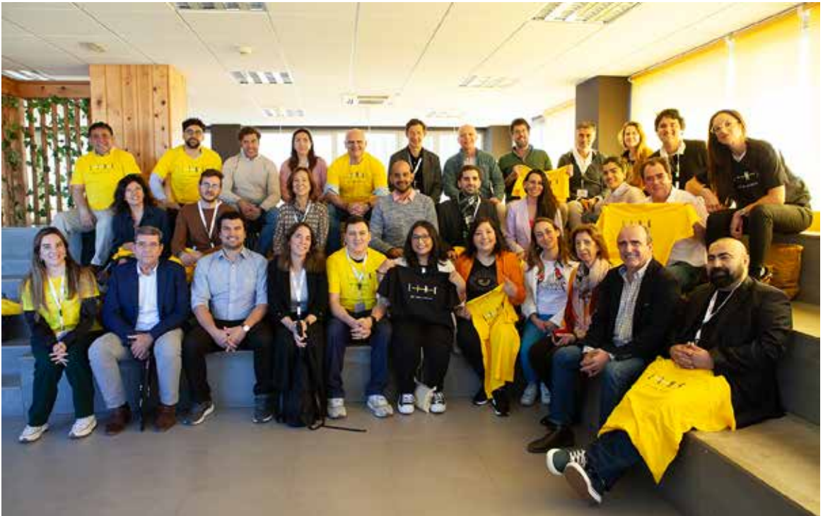
Visita a The Green Ray, espacio de Emprendimiento, Tecnología y Conocimiento de la Universidad de Málaga.