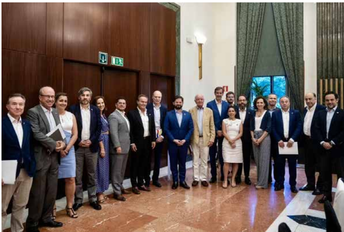
Asistentes al encuentro con el presidente Gabriel Boric.