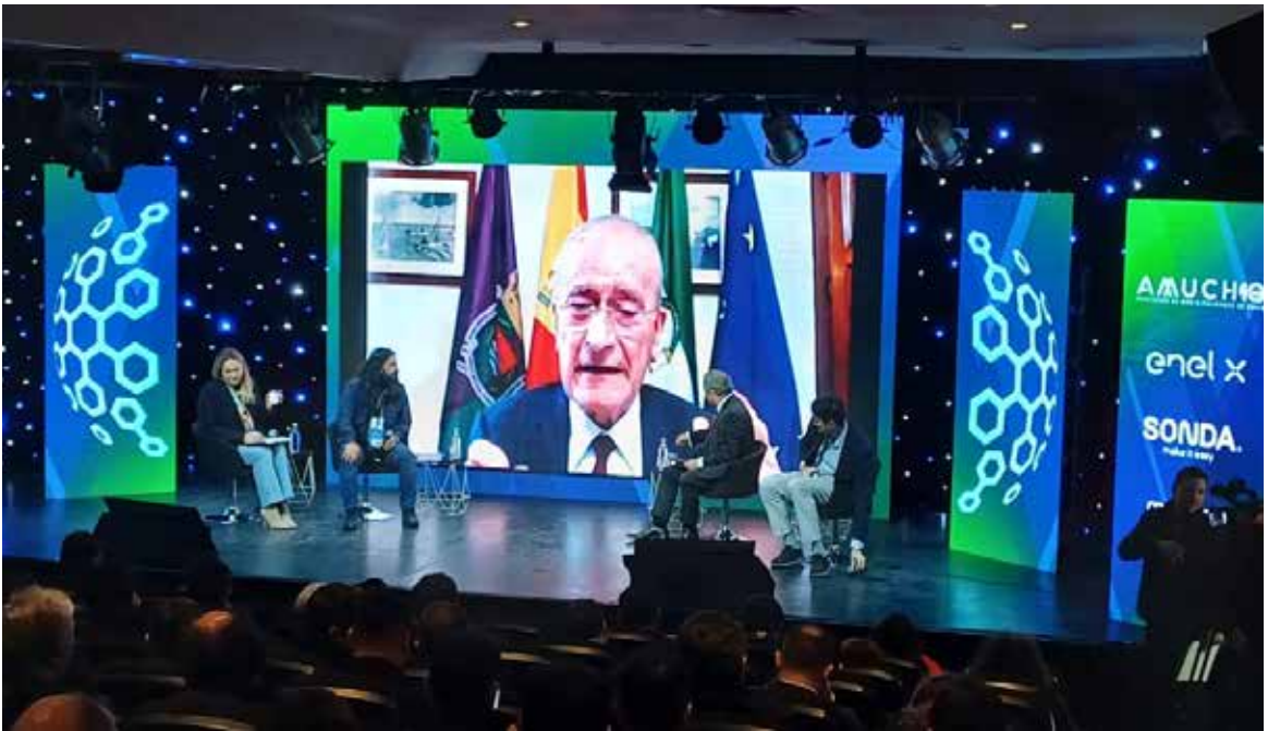
El alcalde de Málaga participa en el IV Encuentro Internacional de Transformación Digital y Ciudades Inteligentes en Santiago de Chile organizado por AMUCH y en el que FCE fue entidad colaboradora.