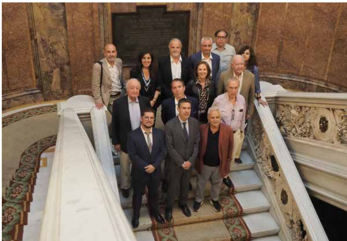
FCE asistió en Casa América a un homenaje en honor al escritor chileno Jorge Edwards.