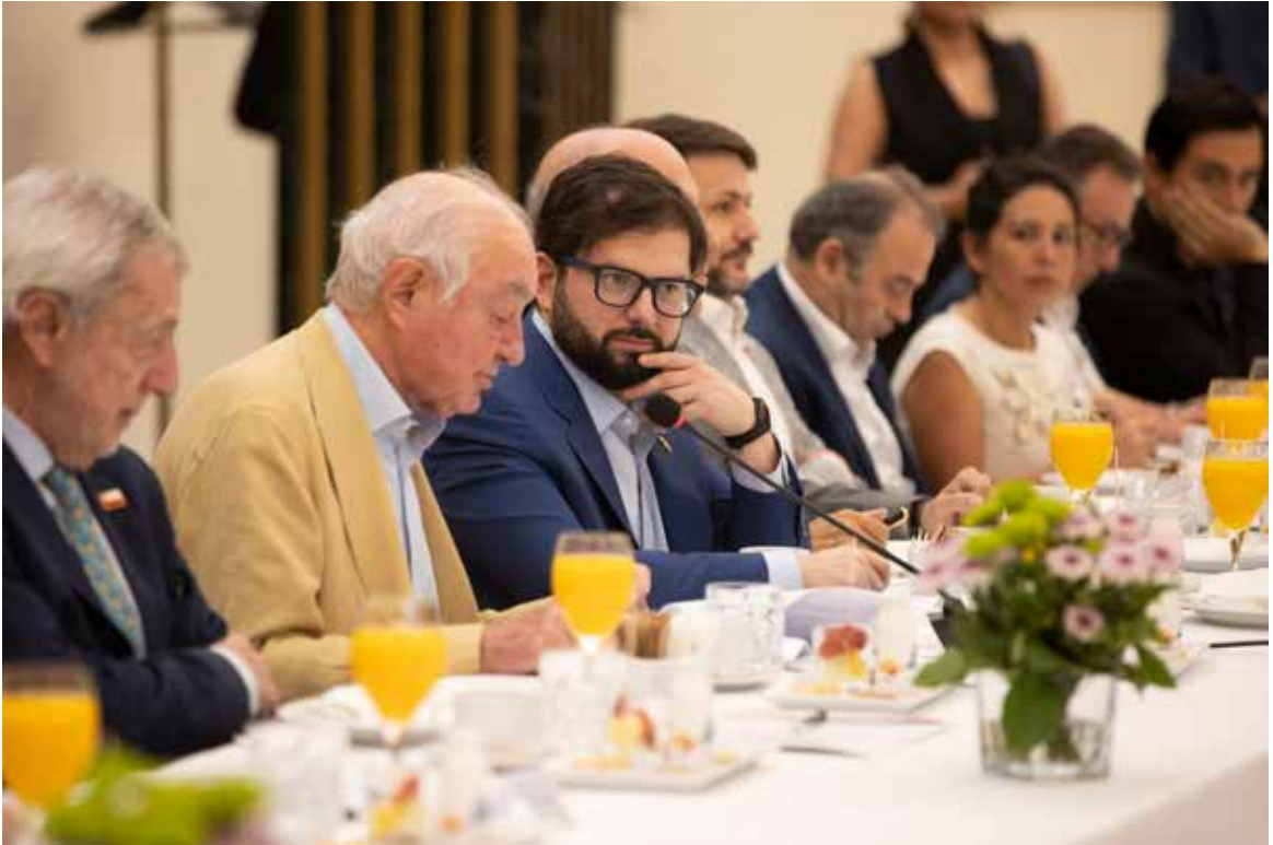
Encuentro institucional con Gabriel Boric, presidente de Chile.