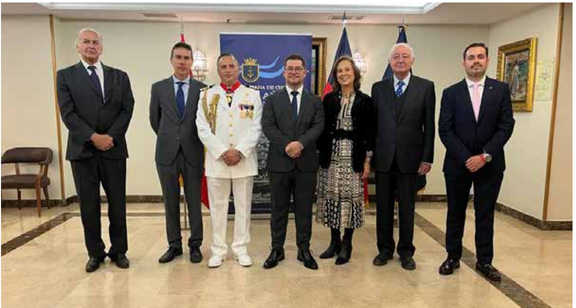
FCE asiste al 144 o aniversario de las Glorias Navales de Chile.