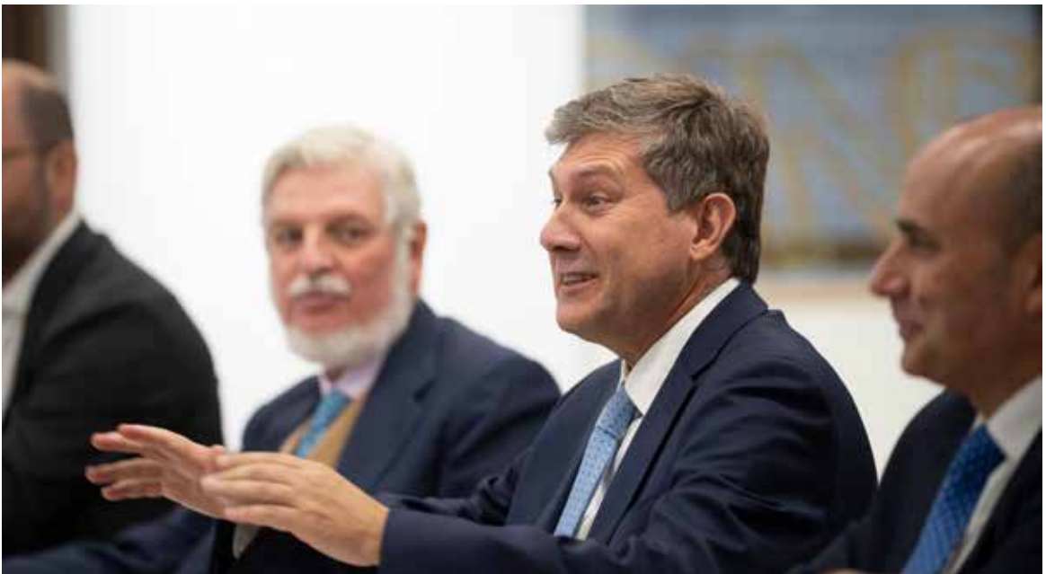
Encuentro con el politólogo chileno Aldo Cassinelli.