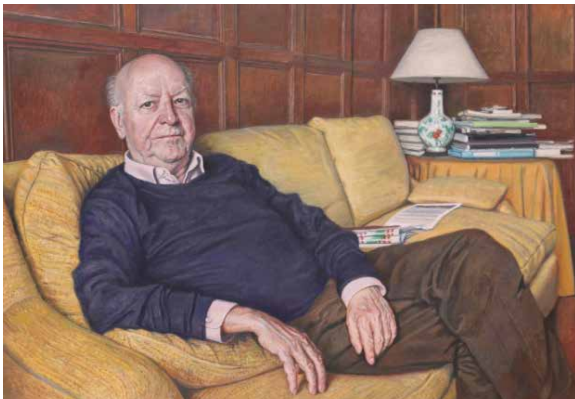
Obituario al escritor chileno Jorge Edwards.