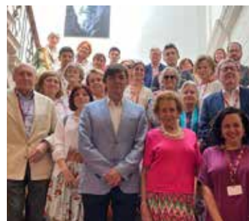
Asistentes al curso.