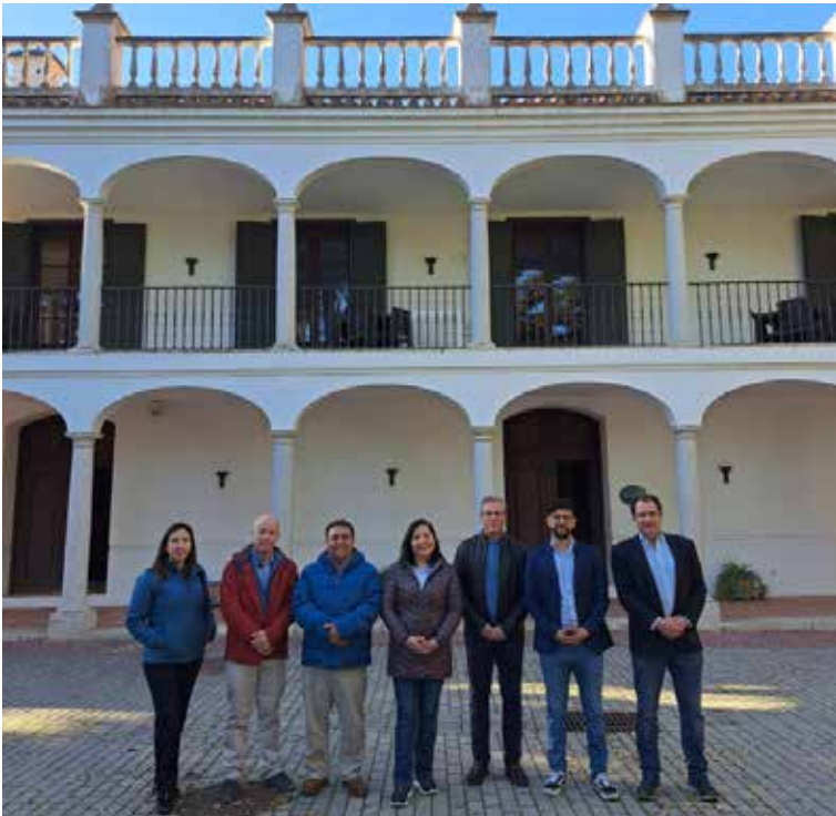
Fachada de la Escuela de Hostelería La Cónsula en Málaga (Andalucía).