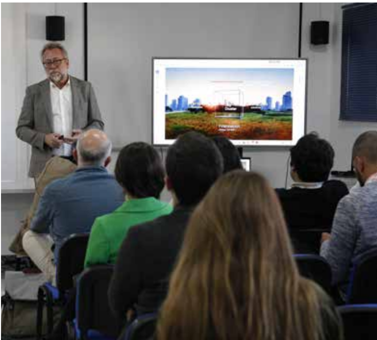
Visita al Smart City Cluster.