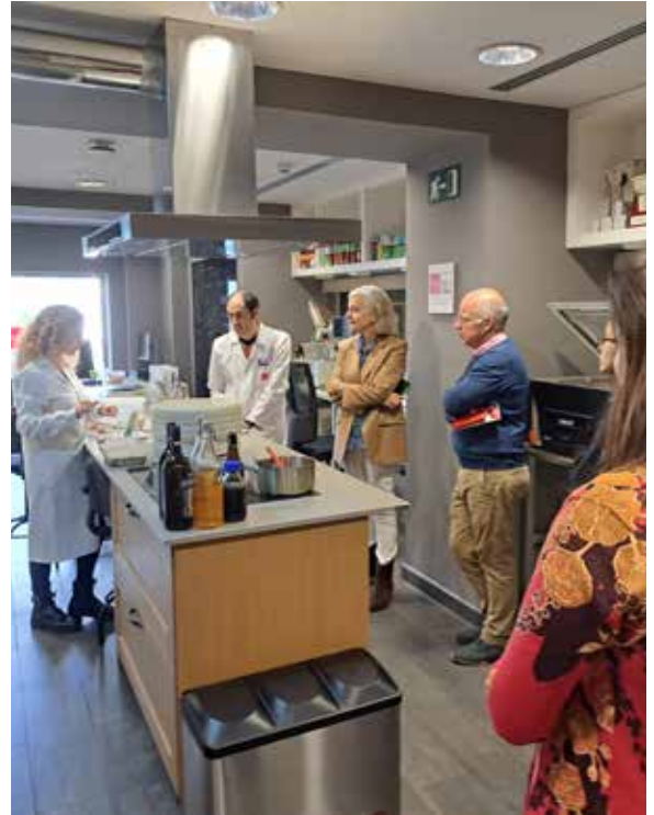
Visita al Centro de Innovación Gastronómica de Madrid y tour por sus instalaciones.