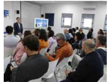
Visita a BIC Euronova.