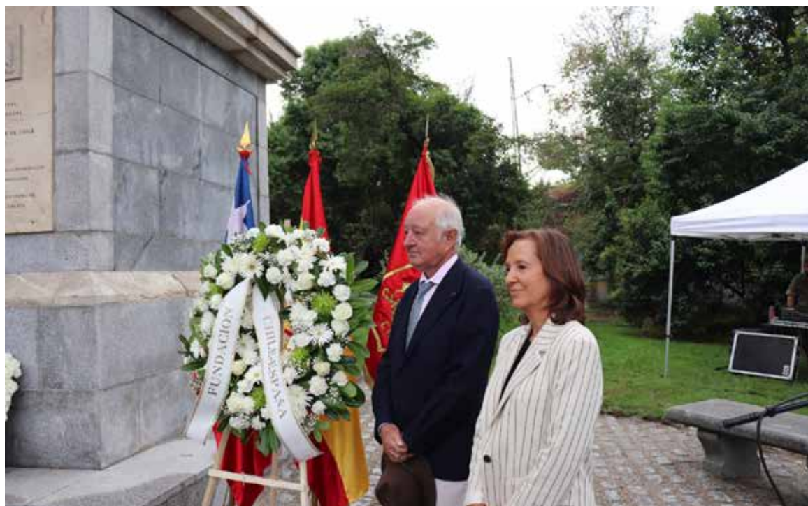
FCE asiste a la ofrenda floral en honor a Bernardo O'Higgins.

Por último, la Fundación se reunió en el primer y segundo semestre de 2023 con su Patronato, ambas desarrolladas en las oficinas de Cuatrecasas, donde se aprobaron por unanimidad la Memoria de Actividades y Cuentas anuales de 2022, y el Plan de Actividades y Presupuesto para 2023. Se abordaron futuros proyectos como el curso sobre Economía Azul en la UIMP o la celebración de la tercera edición de HANGAR 360 en Valdivia.