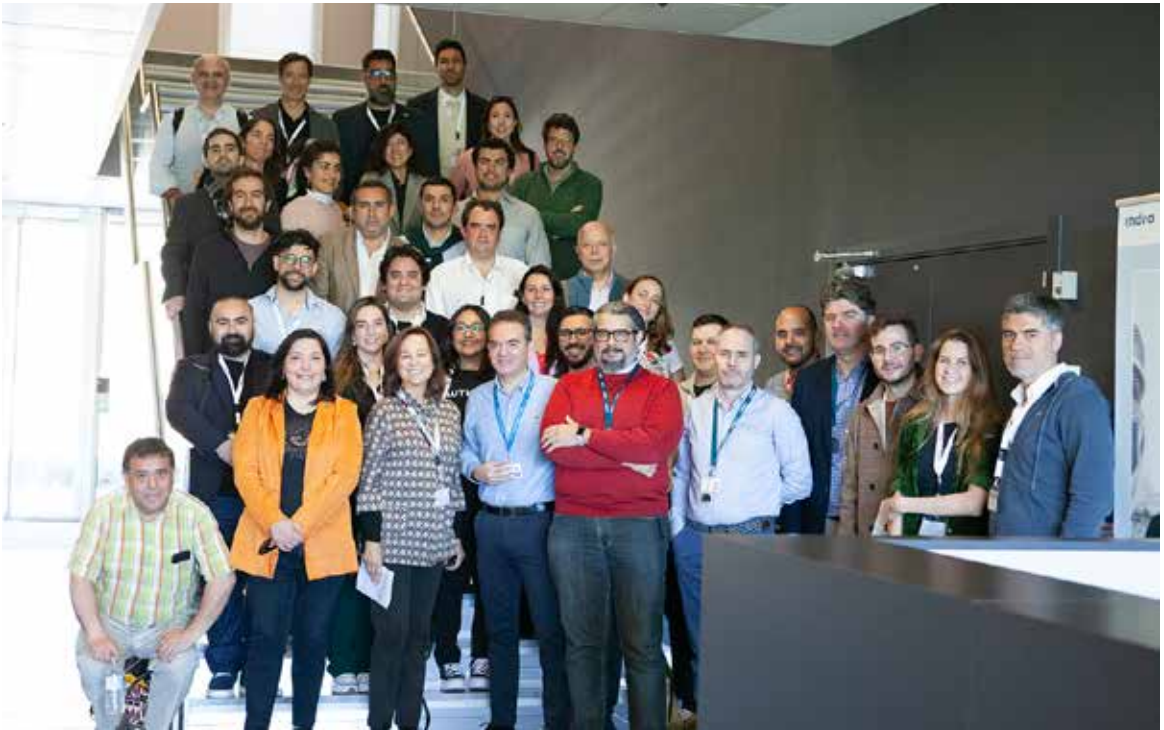
Visita a las oficinas de Indra.