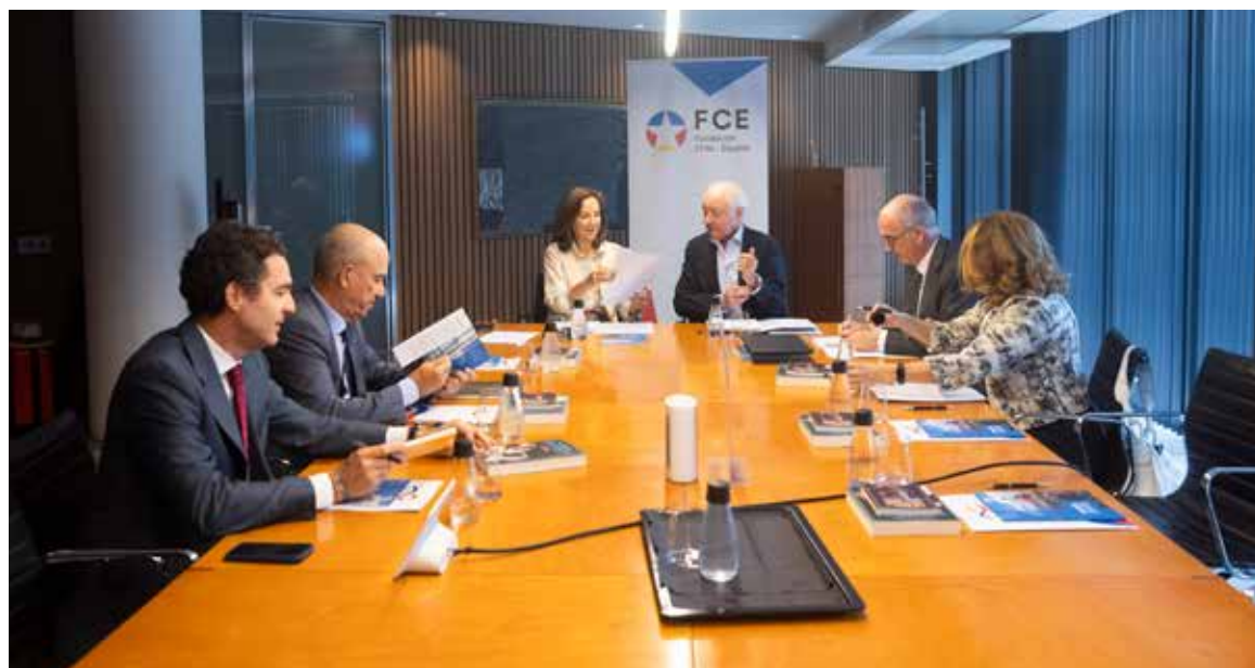
Reunión del Patronato de FCE del primer semestre de 2023.