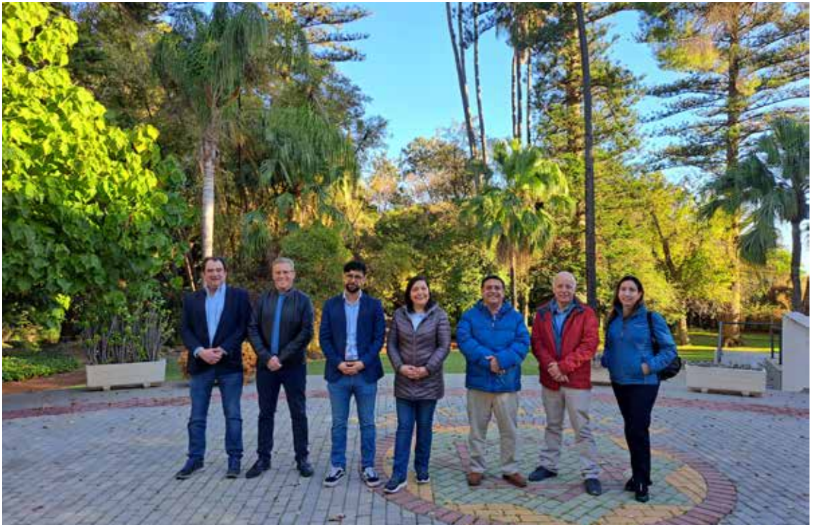
Visita a la Escuela de Hostelería La Cónsula en Málaga (Andalucía).