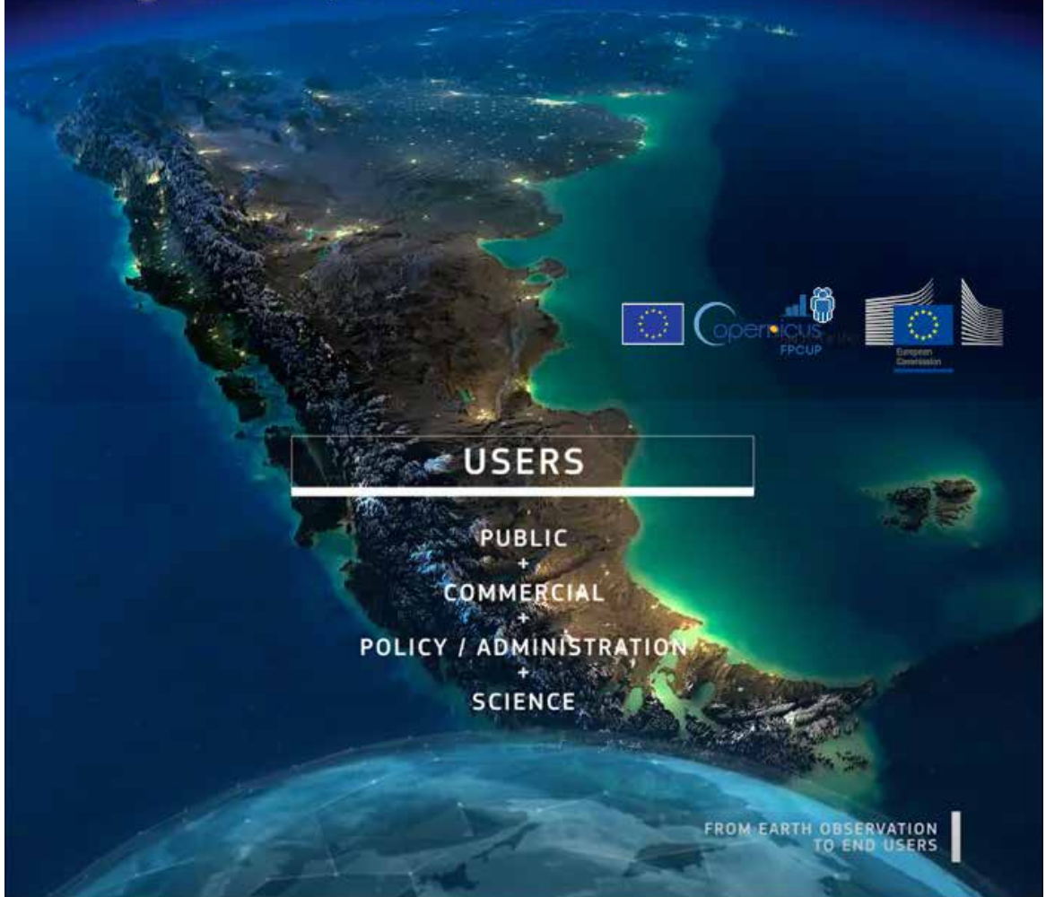
Copernicus llega a Latinoamérica: Reflexiones sobre la observación de la Tierra.