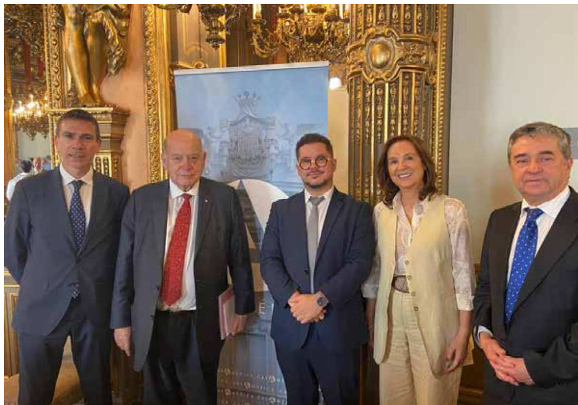
Encuentro sobre “El desafío Constitucional en Chile. Análisis y perspectivas” con Casa América.