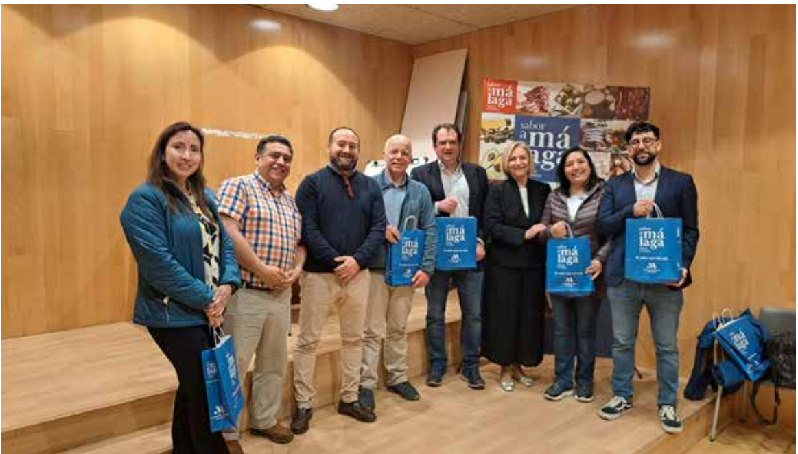
Visita a la sede de la marca Sabor a Málaga.