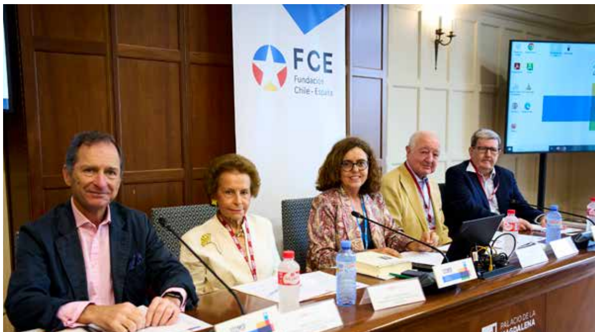
Inauguración del Curso de verano de la UIMP “Ramón de la Serna y Espina: un escritor polidédrico entre España, Alemania y Chile”.