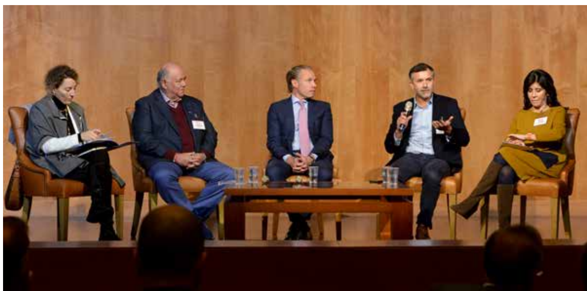
Seminario sobre Economía Azul.