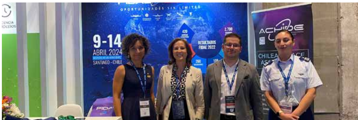
Reunión de FCE y FIDAE en FEINDEF para asistir a la próxima edición de FIDAE 2024 en Chile.