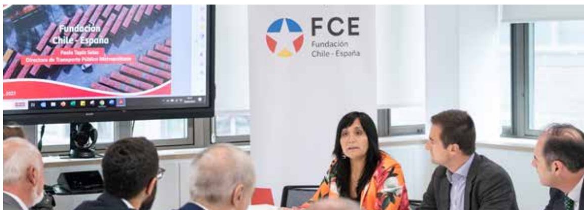
Reunión de trabajo con directora del Directorio de Transporte Público Metropolitanos (DTPM) de Chile, Paola Tapia, para presentar las licitaciones en el Transporte Público Metropolitanos de Chile.