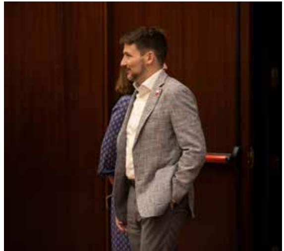
Diego Pardow, ministro de Energía de Chile.