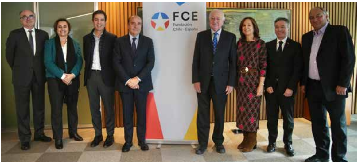
Reunión del Patronato de FCE del segundo semestre 2023.