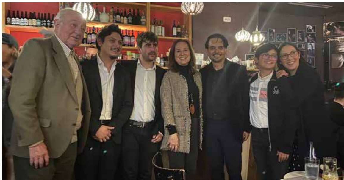
FCE acude a un concierto tributo a Violeta Parra.