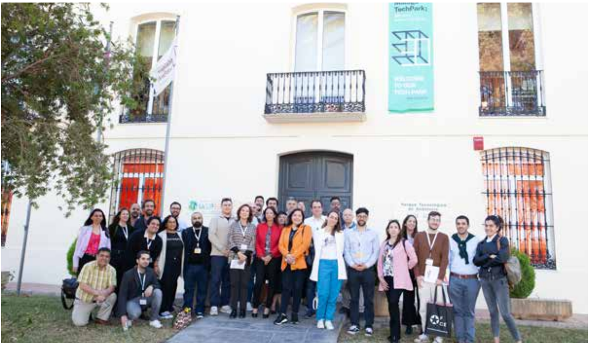
Visita al Málaga Tech Park.