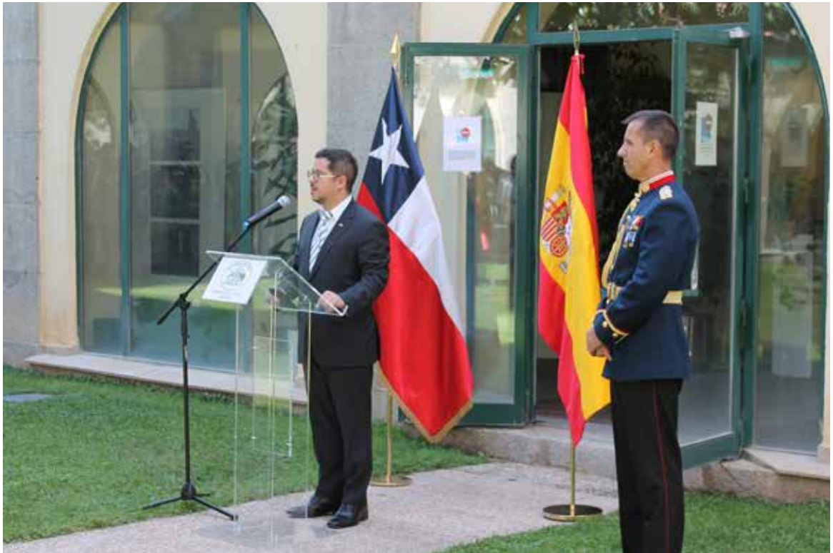
FCE participa en la conmemoración de las Fiestas Patrias.