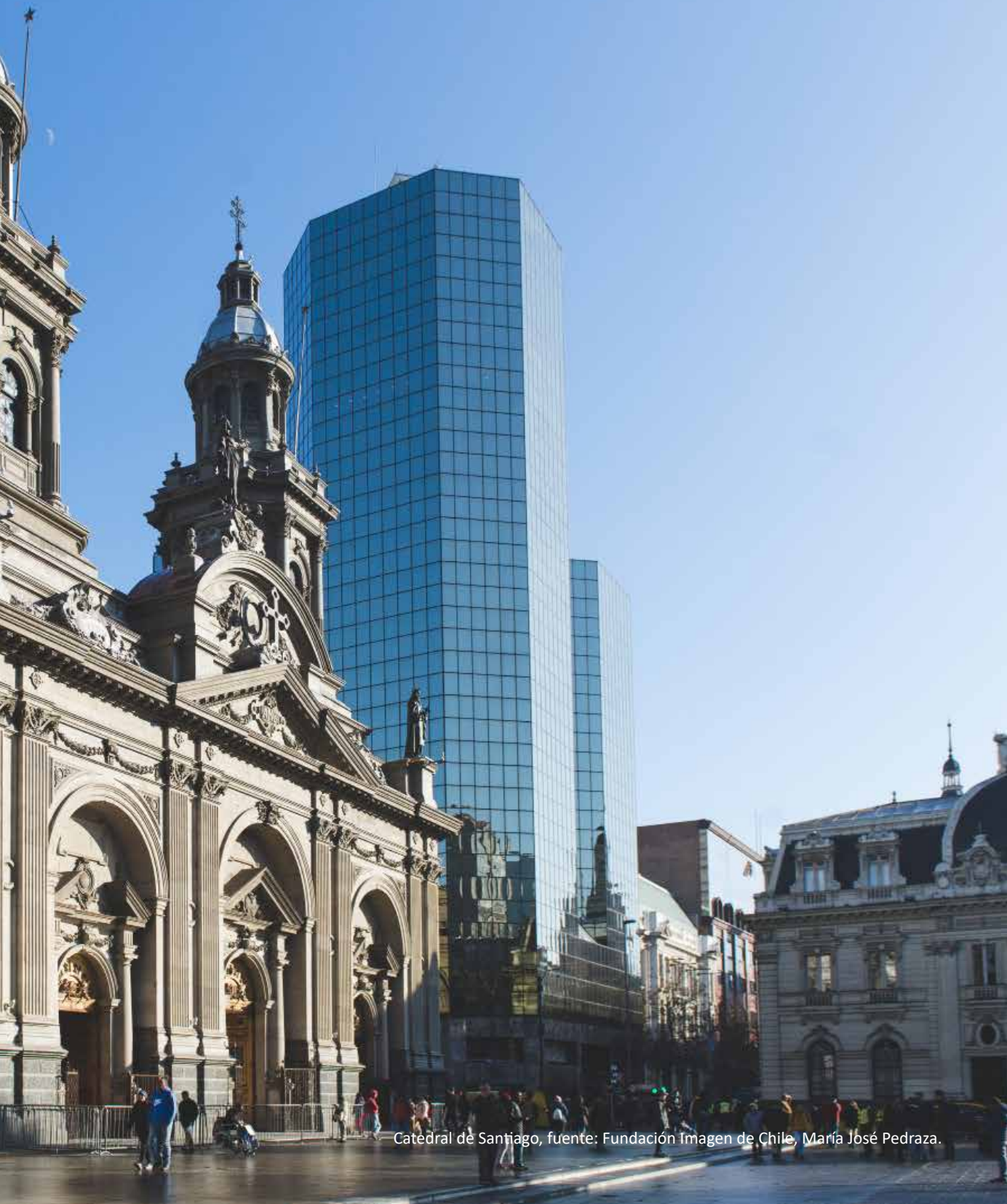
Catedral de Santiago