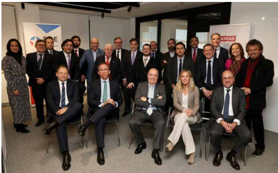
Asistentes al almuerzo con Vlado Mirosevic.