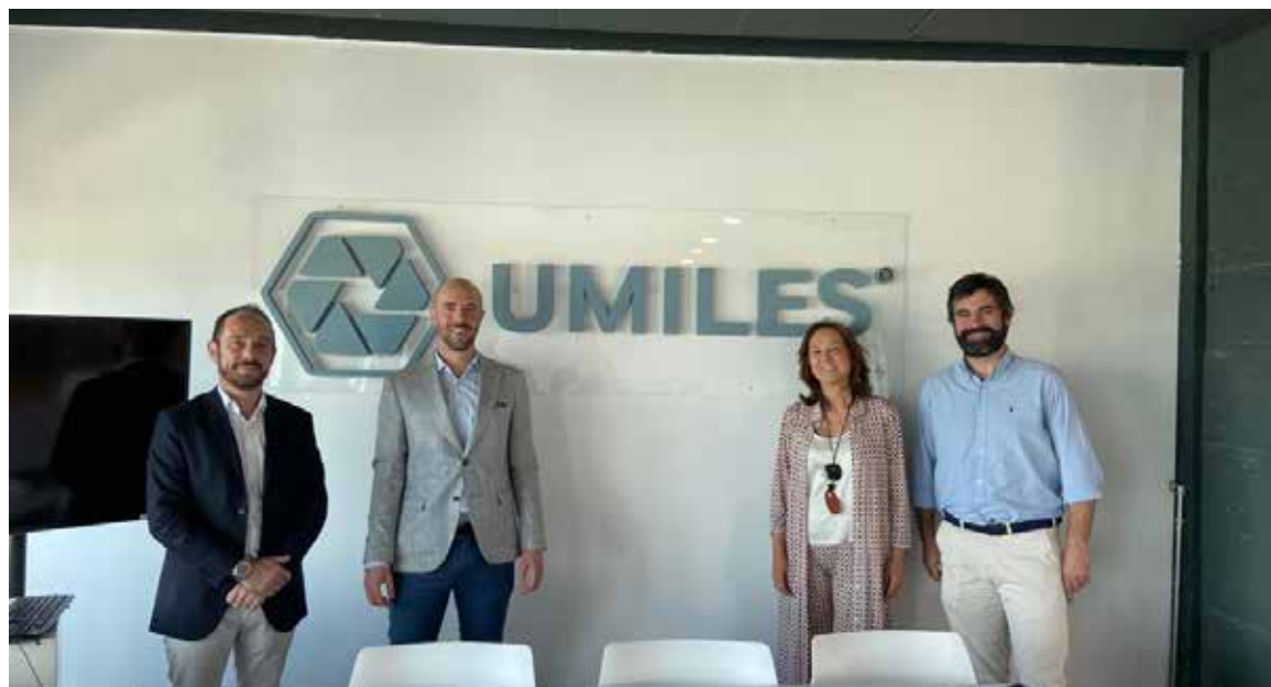
Visita a UMILES.